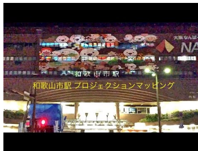
2015年和歌山市駅プロジェクションマッピング