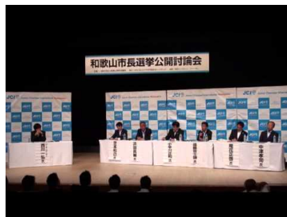
2014年和歌山市長選挙公開討論会

「修練」「奉仕」「友情」という三信条のもと、和歌山市でこれらを実践する活動をおこなっているのが和歌山青年会議所です。