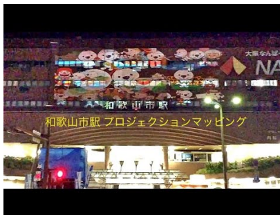
2015年和歌山市駅プロジェクションマッピング