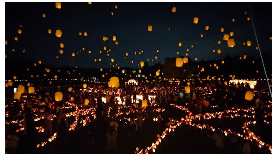
2019年パワーオブわかやま～マチノアカリ～