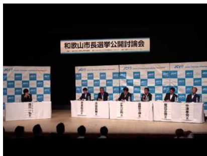
2014年和歌山市長選挙公開討論会

「修練」「奉仕」「友情」という三信条のもと、和歌山市でこれらを実践する活動をおこなっているのが和歌山青年会議所です。